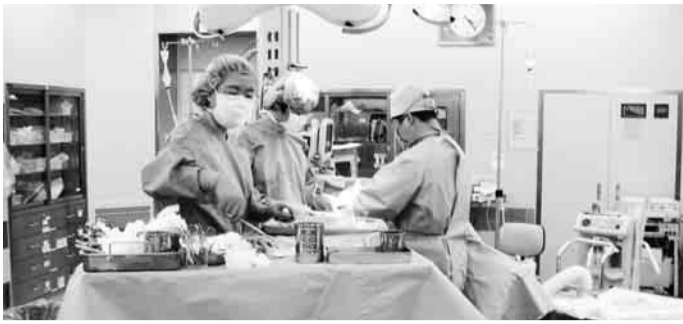
▲市民のあんしん力を高めるため、診療体制がさらに充実します