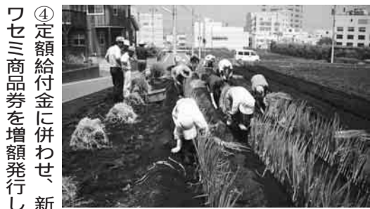
▲農業指導や技術を習得する「農の学校」などの援農活動を進め、都市農地を守ります