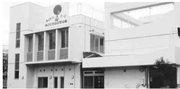
▲子育て子育ての総合施設となる基幹型児童館がオープン(あさひがおか児童館)