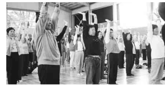
▲年齢や健康状態、ライフスタイルにあわせた運動事業を進めます