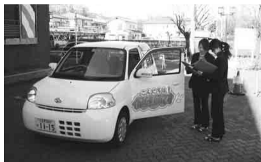
▲保健師のきめ細やかな特定保健指導