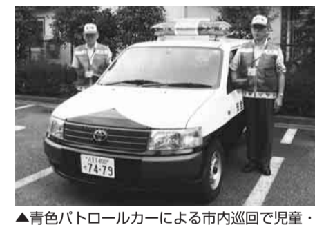
▲青色パトロールカーによる市内巡回で児童・生徒の安全を守ります