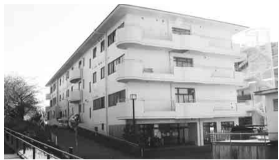
▲待機者解消に向け、21床増床された浅川苑