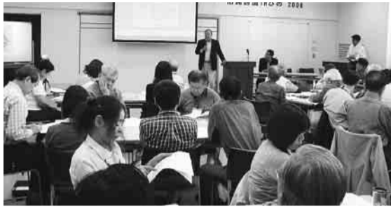
▲市民協働で実施した「市民討議 in ひの2008」。市民と協働することで職員の意識改革を図ります