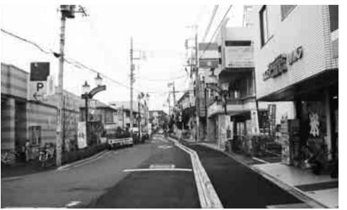
▲百草園駅周辺のバリアフリー化として整備された「おもいやり歩道」