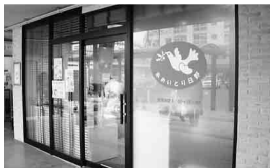
▲市内障害者施設が運営する豊田駅北口ショップ