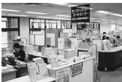
▲生活安定などに向けきめ細やかな支援を 行うセーフティネットコールセンター