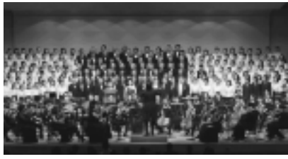
いっしょにコンサートをつくりませんか?

12月20日(日)午後1時開演 / 市民会館大ホール / 7月5日(日)から、毎週日曜日の午前中に練習あり / ソプラノ、アルト、テノール、バス100人 / 参加費1万円 楽譜代実費、高校生以下は無料 / 6月15日(月)までに往復八ガキで。往信用裏面に住所、氏名、年齢、希望パート、第九と合唱の経験、および楽譜の有無を記入し、〒191-8686日野市役所企画調整課芸術文化担当へ