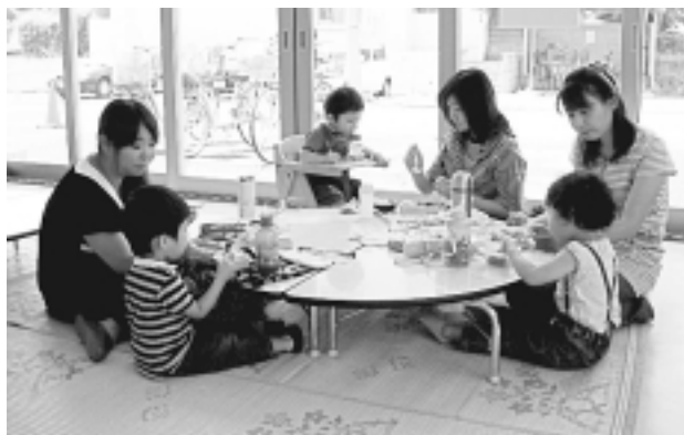
お母さんの作ったお弁当で楽しいランチタイム