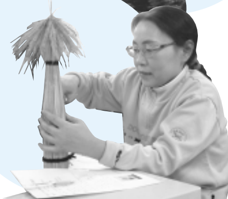
稲わら、竹細工講習会（緑化交流センターにて）