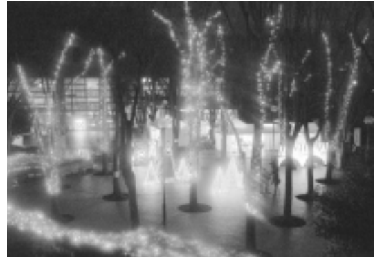
人力発電オブジェ 自転車発電機によるイルミネーションオブジェ

首都大学東京の会場デザインによるメイン イルミネーション 公募市民作品 学生作品~首都大学東京・明星大学の学生の作品