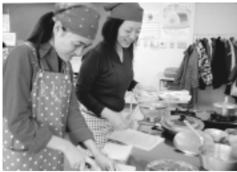
保育つき！元気 簡単朝ごはんクッキング

1月15日(金) 29日(金)午前10時〜11時30分/生活・保健センター/乳幼児・園児・児童の保育つき！元気 簡単朝ごはんクッキング