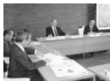
活発な意見が飛び交います(第4期行政改革推進懇談会から)

いずれも3月1日(月)までに郵送またはEメールで。作文「公民協働による行政改革について」今、私たちの出来ること(400字程度)、住所、氏名、ふりがな、性別、生年月日、電話番号、希望するメンバー区分、メールアドレスを記入し、〒191-8686日野市役所行政管理チーム ☒ s_kkn@city.hino.lg.jp へ