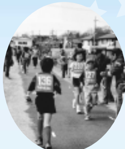
浅川ふれあいマラソン

また、2月は浅川ふれあいマラソン。今年で19回目を迎えます。また、スタッフも楽しみながら小学校の体育館で遊び場「みんなのたまり場」を開催しています。