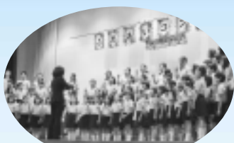
ふれあいコンサート

石坂ファームハウスの協力で、里芋の植付け体験・観察会・収穫祭を行い、夏には、百草団地の夏祭りパトロールに加え出店もし、参加した大人や子どもも大満足でした。また、12月には三中の体育館で毎年恒例の「ふれあいコンサート」。今年は潤徳小の参加もあり、熱気あふれる合唱や合奏が披露されました。