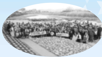
初日の出マラソン

7月のラジオ体操、11月のスポーツまつりinななお、1月の初日の出マラソン、2月のふれあい地域コンサートと、子どもたちが安心して育っていける地域になるよう活動しています。年2回の広報誌「ななお」・広報ひのなどで行事のお知らせをしています。