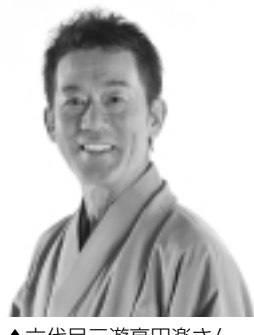
▲六代目三遊亭円楽さん

今春、六代目三遊亭円楽を襲名した宗太郎が、笑点のメンバーとともに華やかな襲名興行を行います。