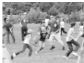
▲みんなでしっぽとり!

日程・内容は左表のとおり / 市内在住の小学5年、中学3年生対象 / 概ね40人 申込多数の場合は抽選 / 中学生1万円、小学生8千円 / 4月30日(金)必着 / までにハガキで。住所、氏名(ふりがな)、電話番号、学校名、学年、性別を記入し、〒191-8686日野市役所子育て課「ジュニア」係へ