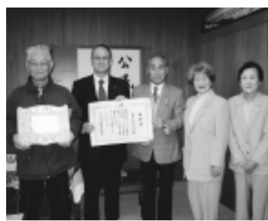
市長(左から2人目)へ受賞報告

日野の自然を守る会が、緑化活動の推進や緑化思想の普及啓発についての顕著な功績が評価され、平成22年緑化推進運動功労者内閣総理大臣表彰を受賞しました。