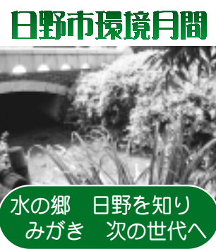
水の郷 日野を知り 次の世代へ みがき

日野市環境月間 市内を用水が網の目のように流れ、たくさんの生き物が生息する水と緑に恵まれた美しいまち日野市。 今月は、環境月間です。日野市の水と緑を見直し、次世代に残せる環境づくりを考えてみましょう。 市内でイベントを実施します。ぜひご参加ください。 緑と清流課