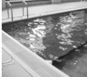
プールフロア(写真上)をプールの底に設置し、水深を浅くしました

利用者の利便性向上のため、東部会館温水プールに水深が0・7～0・9メートルのコースを1つ設置しました。水深が浅くなつており、ご利用しやすくなっています。地域協働課