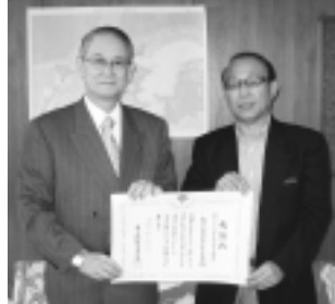
奥住育成会長(写真右)が市長に報告

■大坂上中地区青少年育成会に 東京都教育委員会から感謝状を 贈呈 長年にわたる学校活動の支援