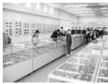
▲京王平山研修センターでの「京王資料館特別公開」