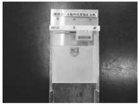
▲JIGにもさまざまな形があります