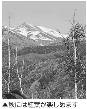
▲秋には紅葉が楽しめます

■八ヶ岳高原大成荘 紅葉は例年10月下旬から始まり、11月中旬にピークを迎えます。川俣川にかかる東沢大橋(通称「赤い橋」)やその下流にある吐竜の滝が有名です。八ヶ岳高原大橋から見る、南アルプ