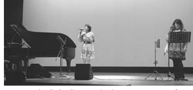
▲日野市成人式にも出演したスリッピーによる演奏をお楽しみください