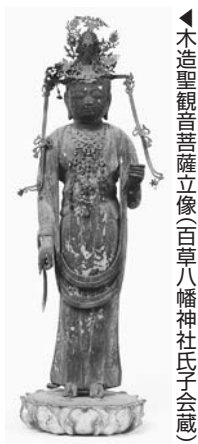
▲木造聖観音菩薩立像(百草八幡神社氏子会蔵)