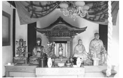
▲百草観音堂仏教彫刻群(日野市指定有形文化財・百草八幡神社氏子会蔵)

10月12日(水)～12月18日(日)午前9時30分～午後5時※入館は午後4時30分まで。月曜日休館。新選組のふるさと歴史館入館料200円※小・中学生50円郷土資料館(☎592-0981)