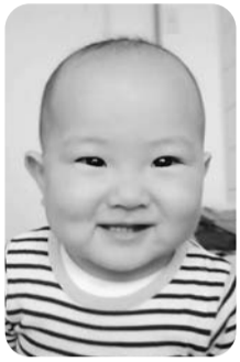
※掲載希望は1歳になる月の前月20日までに市長公室広報担当へ(12月生まれ:11月18日(金)まで)