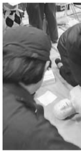
いざという時のために訓練を受けてみませんか

6月は就職差別解消促進月間 人権問題啓発映画会: 6月5日(火)午後2時~4時20分