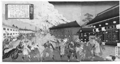
▲薩州屋敷焼撃之図(鶴岡市郷土資料館所蔵)

また、戊辰戦争では庄内(現山形県)で新政府軍と戦い、明治時代には庄内での開墾事業などに従事しました。