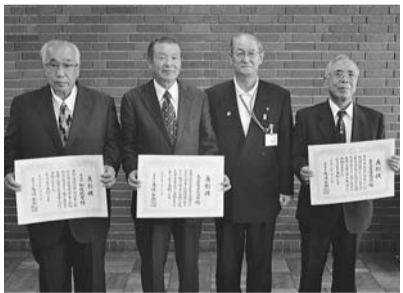
写真左から(株)加藤鉄建、丸石産業(有)、市長、眞生工業(株)の方々

■平成24年度日野市優良請負者の表彰 写真左から(株)加藤鉄建、丸石産業(有)、市長、眞生工業(株)の方々