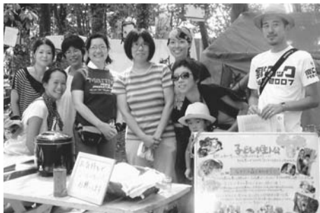
▲自然の中で子どもたちを見守る活動があります

気軽に地域貢献をしながら休日や有意義に過ごしたり、生きがいに富んだ第二の人生を楽しむなど、市民活動には新しい発見があります。興味のある活動にあなたも参加してみませんか？