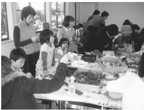
▲手作りの楽器を作って演奏しませんか

不可能と言われた自然エネルギー発電所を立ち上げたドイツの町「シェーナウ」のドキュメンタリー映画 ※その他にもたくさんの催しを行います