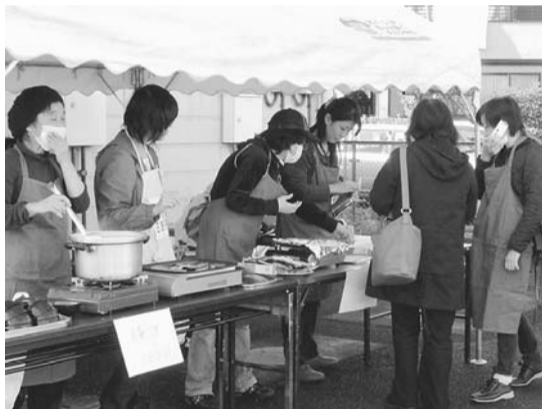
▲野菜や手作り品も販売します