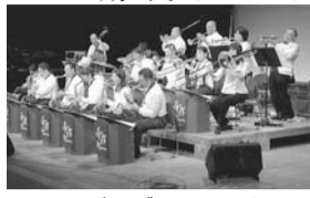
▲SOSジャズオーケストラ

日2月2日(土)午後1時から 市民の森ふれあいホール※直接会場へ 出演：SOSジャズオーケストラ ※東日本大震災の募金活動 あ文化スペース