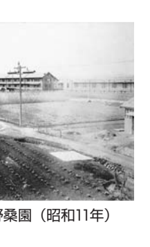
▲蚕業試験場日野桑園(昭和11年)

から、石田の源兵衛島(石田40番地、現・万願寺1丁目)に、万願寺桑園がありました。万願寺桑園は、高円寺(杉並区)にあった農務省原蚕種製造所に桑の葉を供給するために作られ、ここから荷馬車で桑を運んでいました。日野桑園ができたことで、日野桑園が第一桑園、万願寺桑園は第二桑園と呼ばれるようになりました。