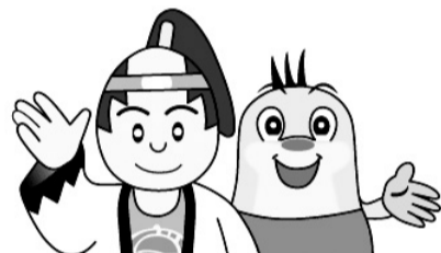
▲ごみ減量啓発キャラクター 帰ってきたぞう&もぐちゃん