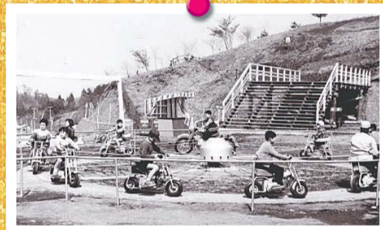
▲多摩テック（昭和38年頃）