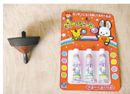
▲駒とビニール風船で遊ぼう

申 はがきまたはEメールで。講演名、住所、氏名を記入し、〒191-0042程久保550郷土資料館（☒museum@city.hino.tokyo.jp）へ