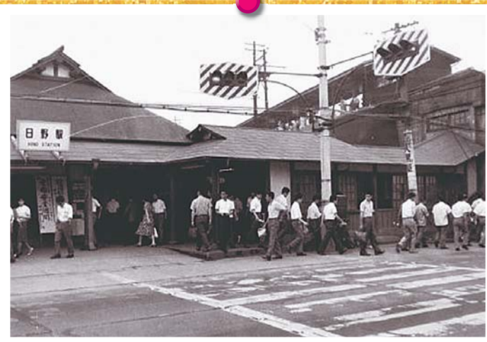
▲日野駅朝の通勤風景（昭和38年頃）

昭和38年11月3日、日野市が誕生しました。それから50年。市では、市制施行50周年を記念して、「日野市の半世紀～移りゆくまちの過去と今そして未来」展を市内4カ所の会場で開催します。