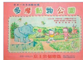
▲多摩動物公園の開園を伝えるチラシ