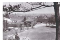
▲潤徳小学校の旧校舎