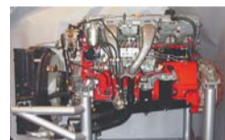
▲巨大エンジン（日野自動車製）