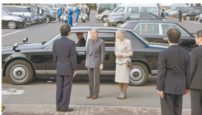
▲会場入口で日野市長が両陛下をお迎えしました