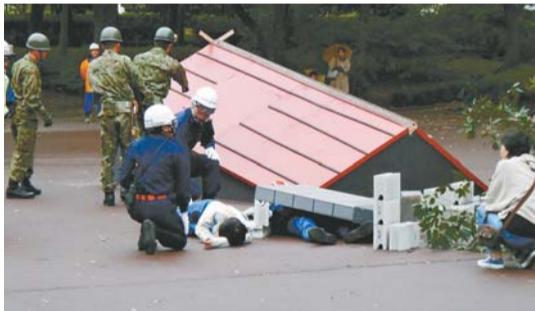
▲倒壊家屋からの救出訓練