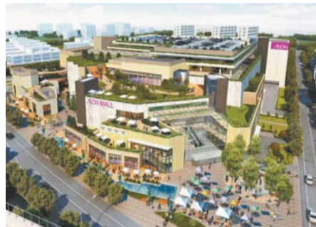
イオンモール完成予想図(O街区)

多摩平の森地区では、昭和31年からUR都市機構(当時の日本住宅公団)により基盤整備が行われ、昭和33年に多摩平団地が建設されました。平成9年には、UR都市機構により老朽化が進んだ多摩平団地の再生事業が始まり、平成20年に整備が終了。現在は整備で生じた余剰地約20ヘクタールについて、民間などの活力を導入し、豊田駅周辺まちづくり協議会などで住民、日野市、UR都市機構による話し合いを重ね、市民参加型のまちづくりを進めています。 広報今号では、多摩平の森地区のまちづくりの進捗状況について、概要をお知らせします。 ■ 園都市計画課