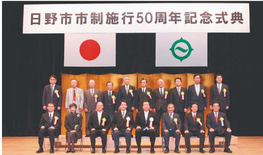
▲50周年記念特別功労表彰者