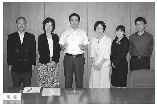
男女平等行動計画平成24年度実施事業の本部・市民評価報告書が完成しました

9月25日に日野市福祉事業団の理事会・評議員会が開催され、(社福)日野市福祉事業団定款の一部改正、(社福)日野市福祉事業団職員就業規則等の一部改正、(社福)日野市福祉事業団組織および事務分掌規程等の一部改正および役員選任などの議案が審議され、全ての議案が承認されました。詳細についてはお問い合わせください。 日野市福祉事業団 (☎589・1818)