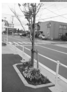
▲除草清掃・草花の植栽がされた歩道植樹帯