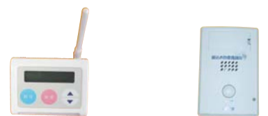
▲迷惑電話チェッカー ▲振り込め詐欺見張り隊

これまで登録していた電話番号にかけ直しましょう。再度連絡してからも遅くはありません。