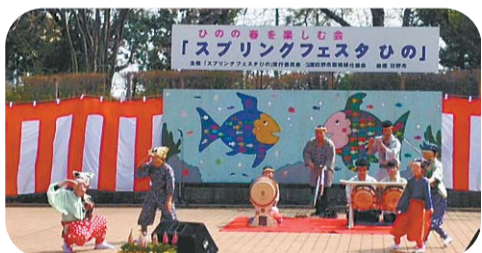
▲日野中央公園「スプリングフェスタひの」での公演(3月29日)