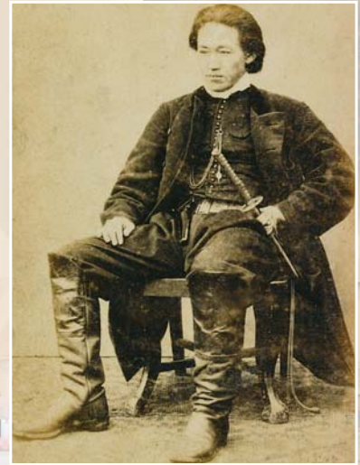
▲土方歳三肖像写真 土方歳三は現在の日野市石田の出身です