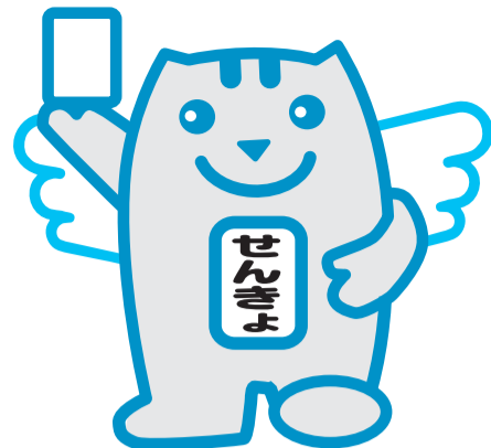
明るい選挙推進のイメージキャラクター 「選挙のめいすい(明推)くん」