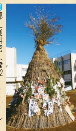
問 郷土資料館 (☎592-0981)

があります。晴天の冬空に、勢いよく燃える火と、パンパンとはじける竹やダルマの音は、冬の風物詩としても良いものです。煙が迷惑と感じる方もいらっしゃるかもしれませんが、一度近くのどんと焼きを見に行かれてはいかがでしょうか。 郷土資料館でのどんと焼きは、1月11日(日)午前10時から開催します。