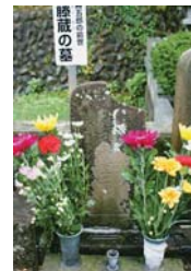
▲藤蔵の墓 (高幡山金剛寺)