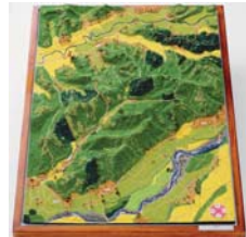
▲勝五郎が歩いた中野村から程久保村への道がわかるジオラマ