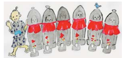
▲藤蔵と程久保六地藏 (叶内匡子画)