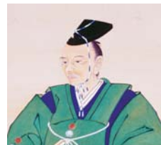
▲『勝五郎再生記聞』の著者平田篤胤 (国立歴史民俗博物館蔵)