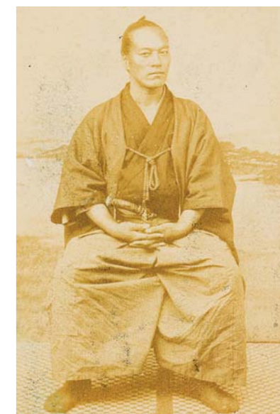
▲山岡鉄舟肖像(福井市立郷土歴史博物館所蔵)(パネル展示)