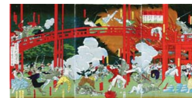
◀ 東叡山文殊楼焼討之図(日野市所蔵) 彰義隊と官軍が戦った上野戦争の様子