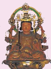
高幡不動尊 金剛寺