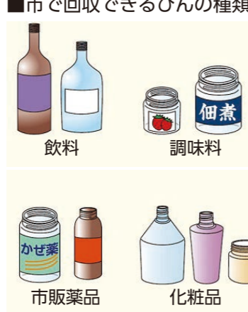
※キャップをはずして中を洗う。ラベルは無理にはずす必要はありません

市販薬以外のびんは回収できません 薬局で調剤された医薬品のびんは、市では回収できません。 調剤された薬局にお返しいただくか、専門の処理業者に処理を依頼してください。 なお、市で回収しているびんは、飲料、調味料、化粧品、市販薬品のガラスびんなどです。