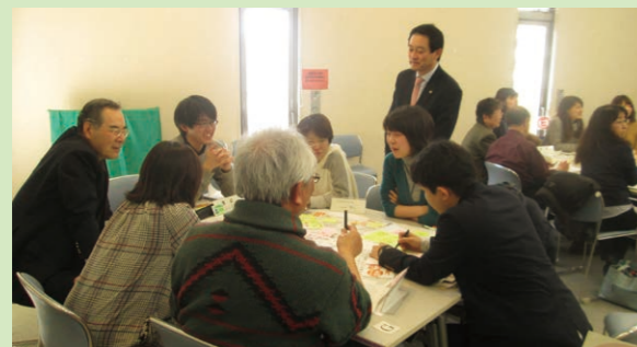
■地域懇談会日程表