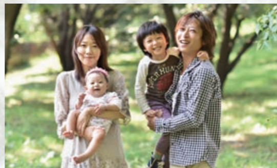
▲平成27年度家族ふれ愛大賞受賞作品