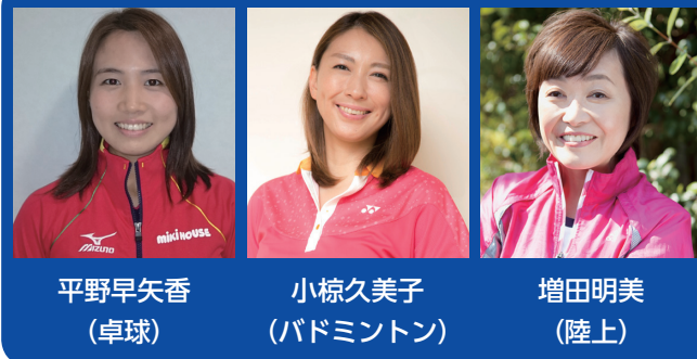
平野早矢香 (卓球) 小椋久美子 (バドミントン) 増田明美 (陸上)