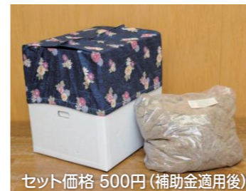
セット価格 500円(補助金適用後)