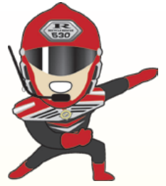
▲ごみゼロマンレッド

毎年好評の「夏休みごみ探検隊」が7/25～27、8/16～18に開催され186人が参加しました。普段入ることができないクリーンセンターで、日野市のごみがどのように処理されるかを勉強したり、クイズラリーでは当選者へ「ごみ減量啓発戦士ごみゼロマンレッド・ヴェルディ」や「エコアラ・エコクマ」から素敵なプレゼントもあり、参加した子供たちは大喜びでした。