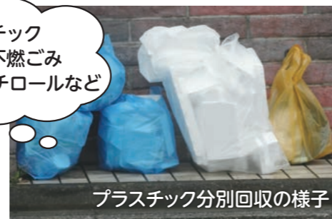
プラスチック分別回収の様子