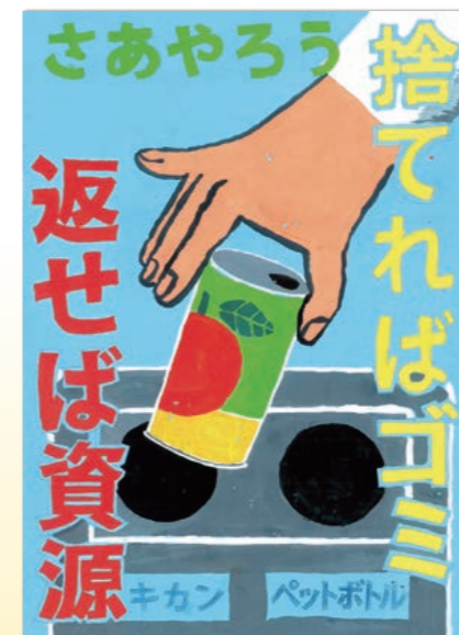
今野 優希 (八小4年)