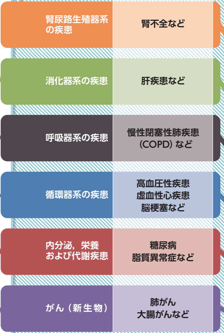
1年間の疾病分類別・年齢別総医療費と各疾病分類別医療費の占める割合 (平成27年度、5歳刻み)