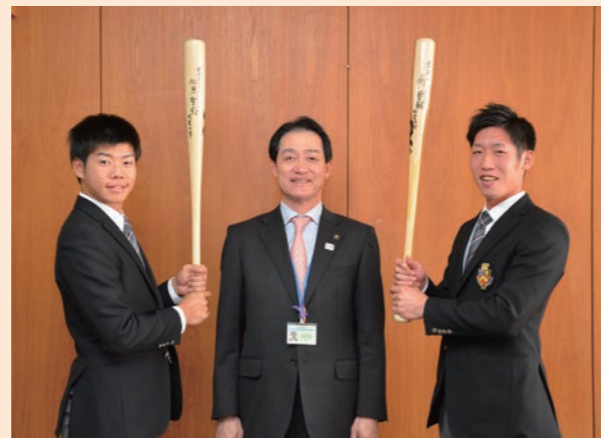
▲写真左から松原さん、市長、南さん