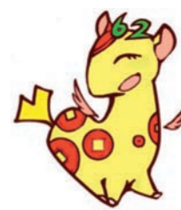
個人住民税PRキャラクター げいきりん