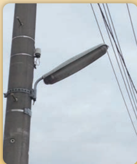
従来(蛍光灯・水銀灯)の灯具

工事期間 7月中旬～平成30年1月中旬 (予定) ※LED街路灯への交換工事に当たり、高所作業車などにより工事を行うため、一部交通規制などを行います。皆さまのご理解・ご協力をお願いします