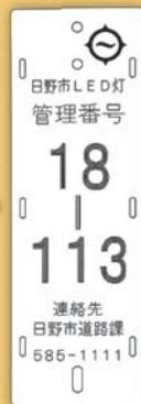
新たなLED灯 管理番号プレート