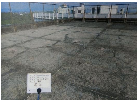
▲新校舎屋上ひび割れ