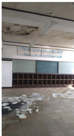
◀旧校舎雨漏りによる天井落下