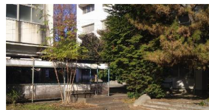
▲②体育館・旧校舎の間