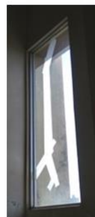
▲新校舎ガラスヒビ