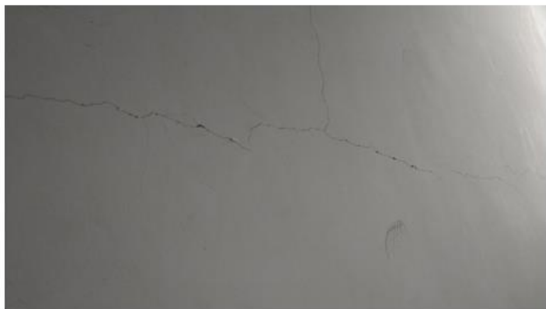
▲新校舎室内壁ヒビ