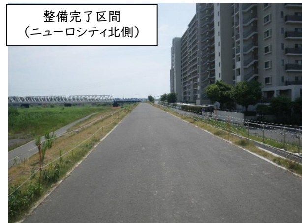
整備完了区間 (ニューロシティ北側)