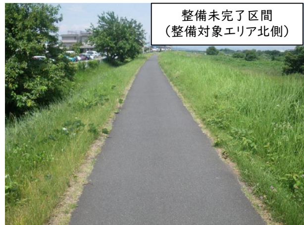
整備未完了区間 (整備対象エリア北側)