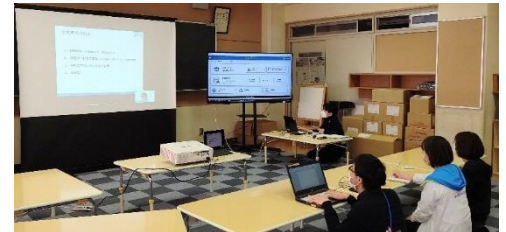
プレゼンルームとして