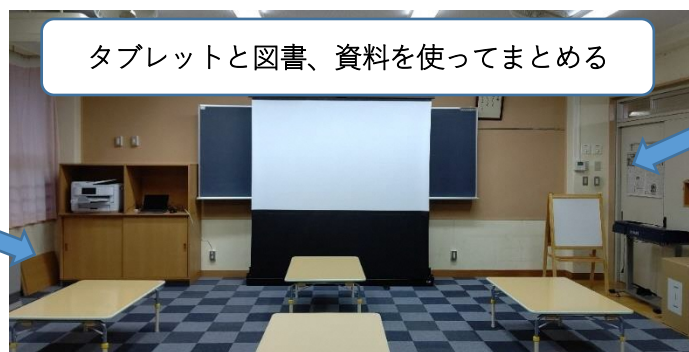
タブレットと図書、資料を使ってまとめる