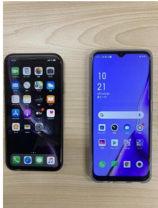
○スマートフォン (左 iPhone、右 android)