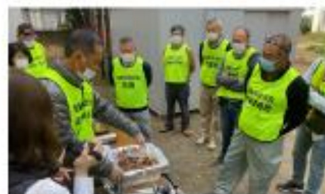
潤徳小学校での避難所運営勉強会・避難訓練

災害時などでの「共助」には住民同士の「顔の見える関係」が大切です。南新井まつりなどのイベントでの交流が欠かせません。今後は地域交流とともに防災を柱とした自治会活動への転換を進めてまいります。