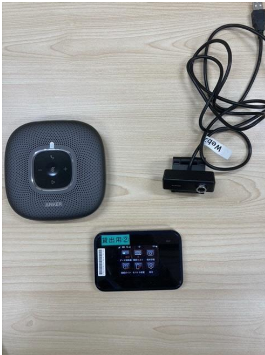
○オンライン会議セット

自治会役員会等でのオンライン会議及び自治会主催のスマートフォン講座での利用に限ります。